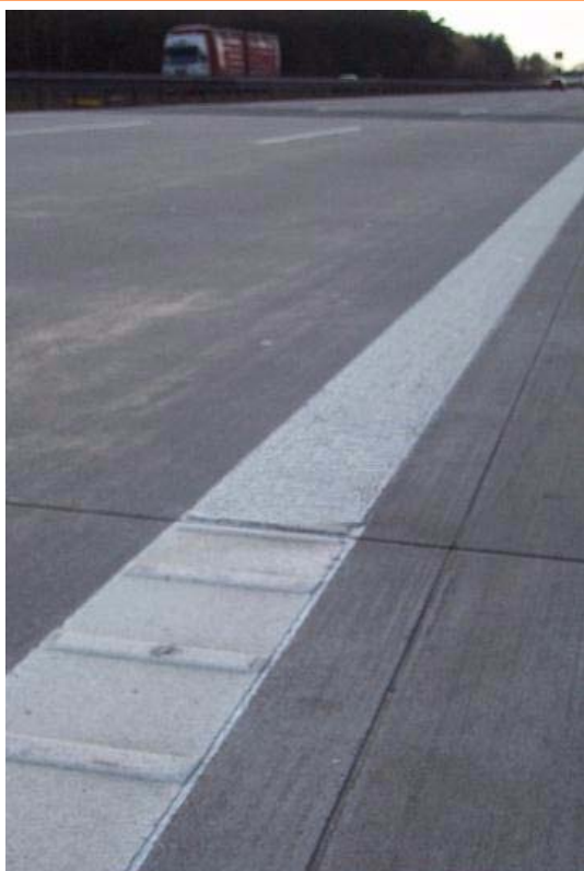
Переход края разметки КП профилир./ КП термопластик на ВАВ А 2 днем, дорожное полотно в напр. Ганновера 5,0 км