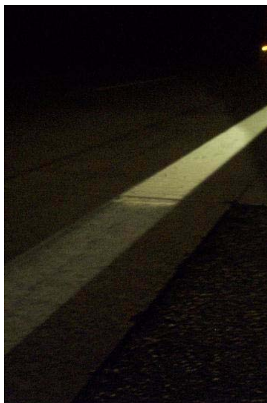
Переход края разметки Краска/ КП термопластик на ВАВ А 2 ночью, дорожное полотно в напр. Ганновера 12,5 км