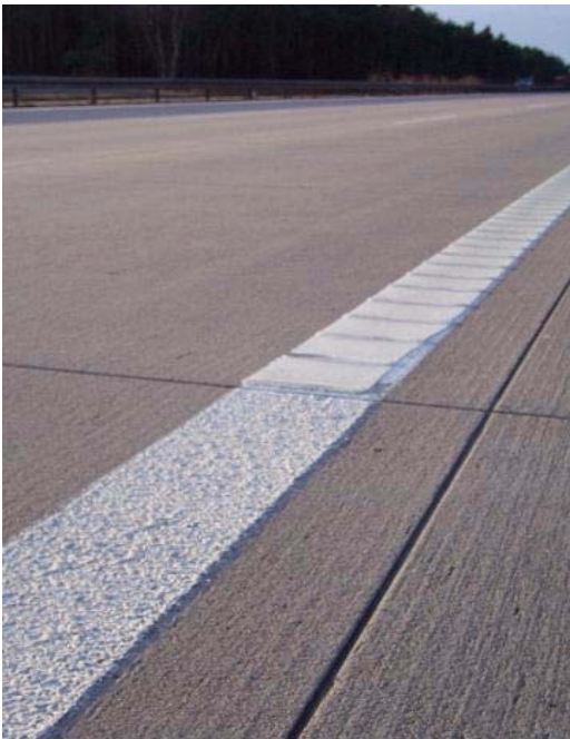
Переход края разметки КП термопластик/ КП поперечное профилирование 90° на, ВАВ А 2 днем, дорожное полотно в