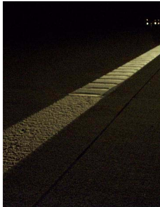
Переход края разметки КП термопластик/ КП поперечное профилирование 90° на ВАВ А 2 ночью, дорожное полотно в направлении