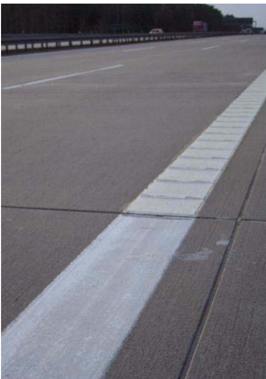
направлении Ганновера 13,5 км Переход края разметки Краска/ КП поперечное профилирование 90° на, ВАВ А 2 днем, дорожное полотно в направлении Ганновера 15,3 км