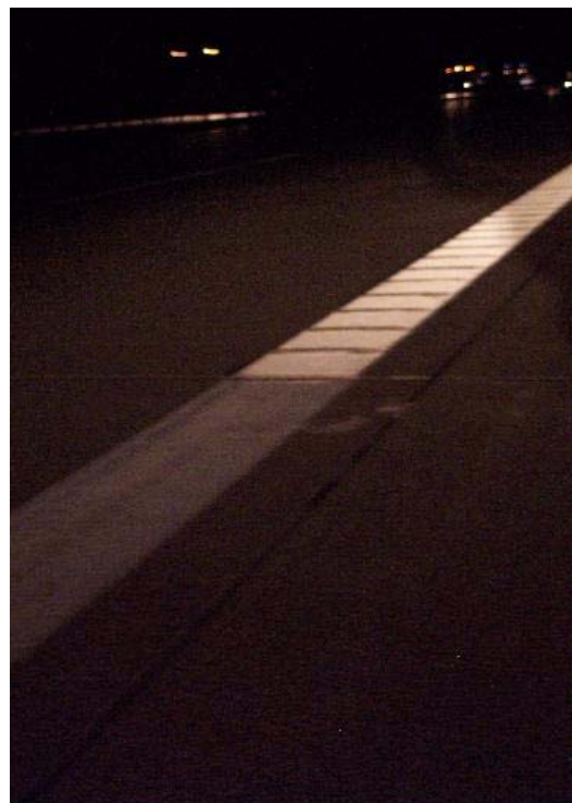
Ганновера 13,5 км Переход края разметки Краска/ КП поперечное профилирование 90° на ВАВ А 2 ночью, дорожное полотно в направлении Ганновера 15,3 км