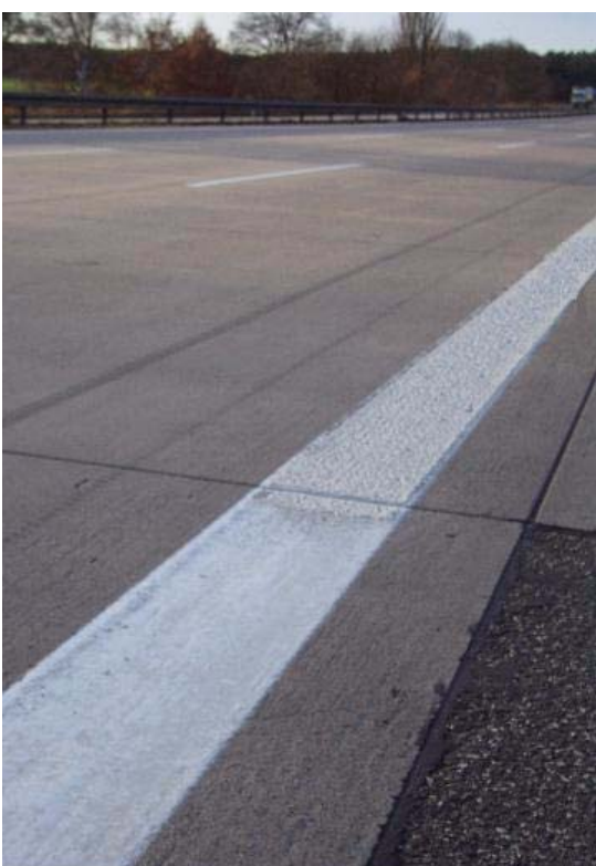
Переход края разметки Краска/ КП термопластик на ВАВ А 2 днем, дорожное полотно в напр. Ганновера 12,5 км