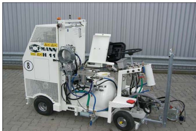
H11-1 avec entretien simple: accès aisé...