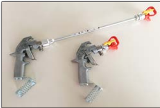
Graco® Airless Farb-Handspritzpistole

(U): Umkehrdüse (Drehdüse): für eher kleine Farbmengen; komfortable Reinigung