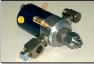
VIALINE Airless Farbspritzpistole