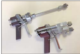
Airless 2K Handspritzpistole M 98:2 und M1:1