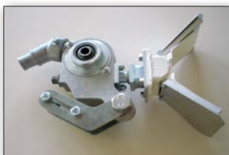
двойной дозирующий пистолет для стеклошариков