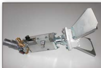
двойной пистолет для стеклошариков