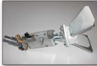
Пистолет за перли