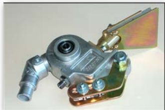
Pistola de esferas dosificadora