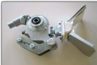
Pistola de esferas dosificadora doble