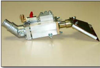
Pistola de esferas