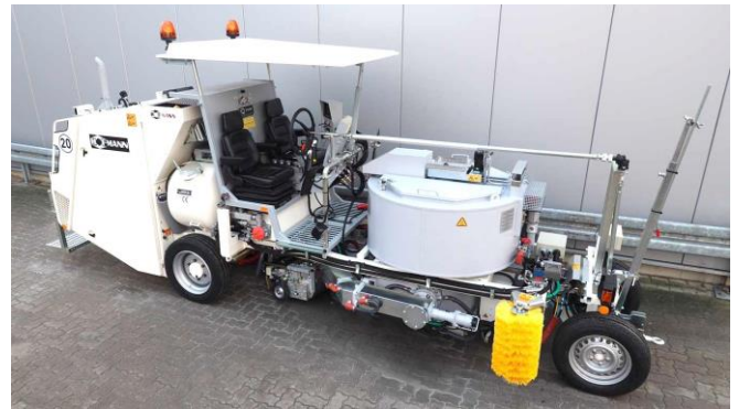
Extrusor giratorio debajo del depósito

Cada vez más países restringen el marcado en contra de la dirección del tráfico; las razones de esto son los problemas de la seguridad vial y la obstrucción del tráfico.