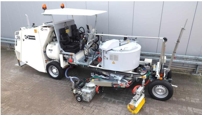
Extrusor giratorio al lado del depósito