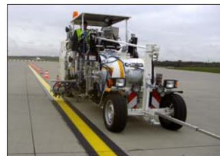
H33 en Hamburgo / Alemania con sistema de pinturas en frío de 1-componente Airless con 5 bombas Airless, 1 x 460 l y 2 x 220 l así como 2 x 110 l depósitos presurizados ...