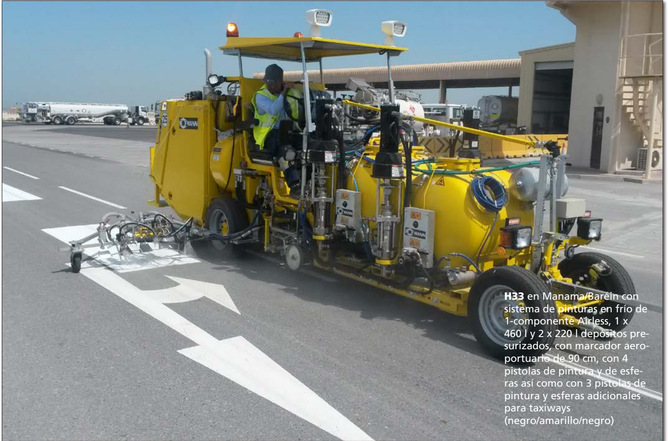
H33 en Manama/Barein con sistema de pinturas en frío de 1-componente Airless, 1 x 460 l y 2 x 220 l depósitos presurizados, con marcador aeroportuario de 90 cm, con 4 pistolas de pintura y de esferas así como con 3 pistolas de pintura y esferas adicionales para taxiways (negro/amarillo/negro)