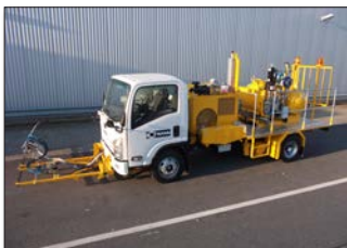
H36-800P en Hong Kong/China para pinturas en frío de 1-componente Airless con marcador aeroportuario de 90 cm y 4 pistolas de pintura y esferas, 1 x 385 l y 2 x 220 l (dividido) depósitos presurizados