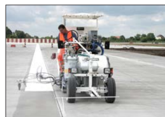
H26 en el terreno de la compañía Airbus, Hamburgo / Alemania equipada con sistema de pinturas en frío de 1-componente Airless así como pinturas plásticas en frío pulverizables de 2-componentes Airless M98:2, 460 l depósito presurizado así como marcador aeroportuario de 90 cm y 3 pistolas de pintura