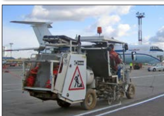
H26 en San Petersburgo/Rusia equipada para pinturas en frío de 1-componente así como sistema Airless 98:2 para plásticas en frío pulverizables de 2-componentes, depósito presurizado de 460 l, para el uso con una pistola de pintura o bien una pistola de 2-componentes para taxiways