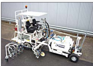
H18 para Royal Air Force/UK con sistema de pinturas en frío de 1-componente Airless (dos bombas) con marcador aeroportuario de 90 cm y 4 pistolas de pintura y esferas así como 3 pistolas de pintura y esferas para aplicar taxiways (negro/ amarillo/negro), 2 x 225 l depósito presurizado