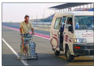
H5-1 Лозали, международная гоночная трасса Доха, Катар