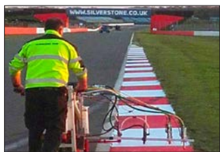
H9-1 Сильверстоун, гоночная трасса Сильверстоун, Великобритания