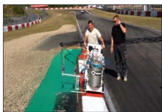
H9-1 Nürburgring à Nürburg, Allemagne