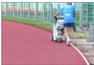
H5-1 Stade olympique à Rome, Italie