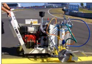
H9-1 Nürburgring à Nürburg, Allemagne