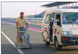
H5-1 Losail International Circuito en la Doha, Catar