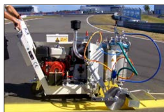
H9-1 Nürburgring in Nürburg, Deutschland