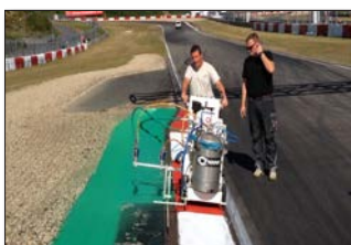
H9-1 Nürburgring in Nürburg, Deutschland