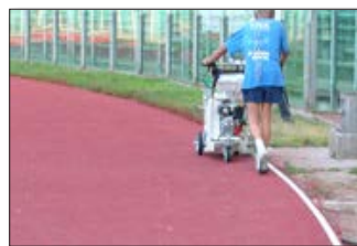
H5-1 Olympiastadion in Rom, Italien